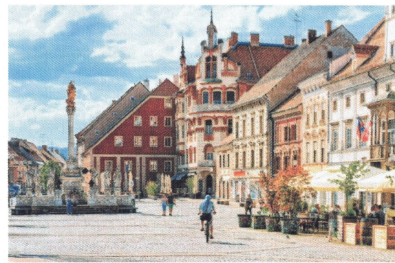
Maribor - Hauptplatz